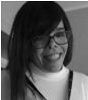
Jesús Viscarri Organización