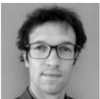
Patricia Esteban Comunicación