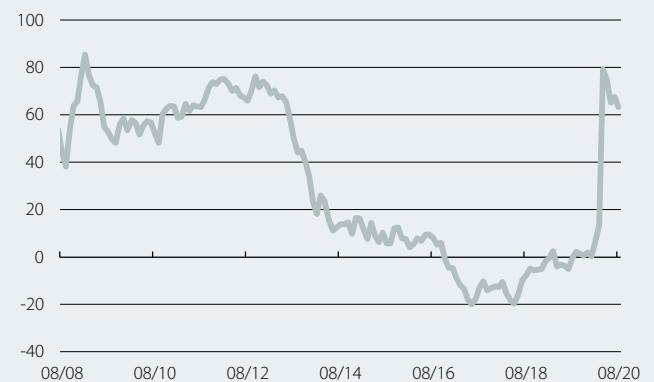
Font: CaixaBank Research, a partir de dades de l'INE de Portugal.

sobre la confiança dels consumidors (vegeu el segon gràfic), les perspectives per a l'evolució de l'atur en els 12 propers mesos són desfavorables.